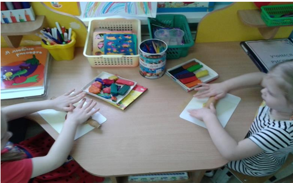
Рис. 9 Лепка «Кружечка» (раскатывание пластилина скалкой)

Нетрадиционные техники в изобразительной деятельности: