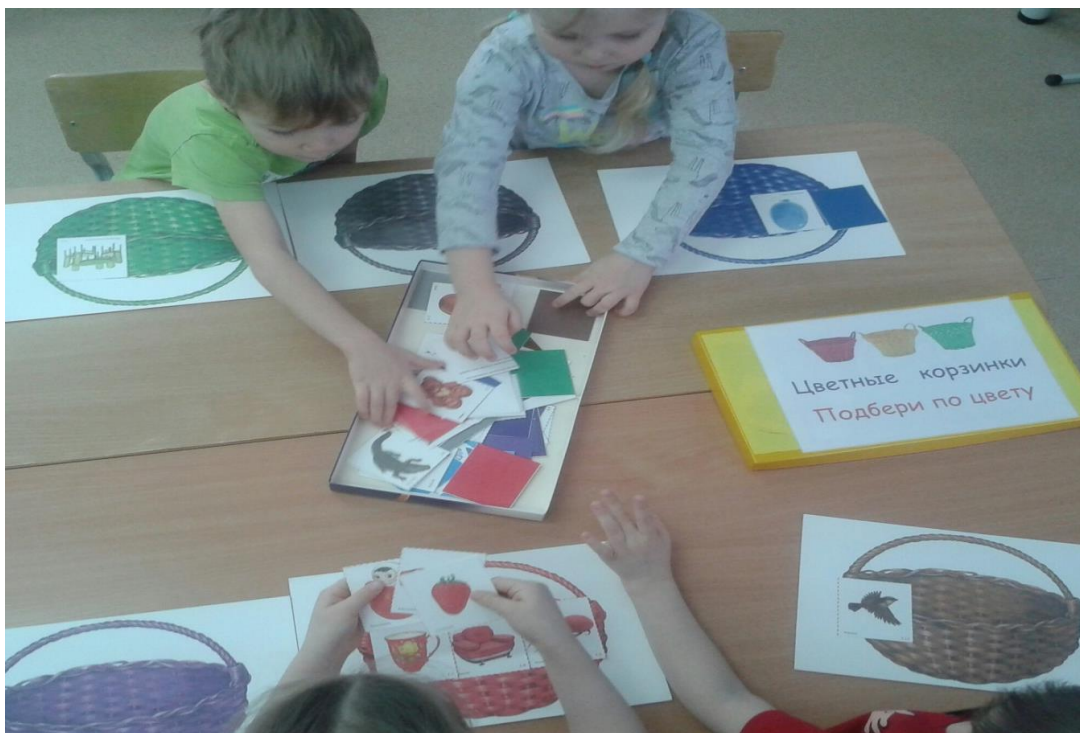
Рис.3 Дидактическая игра «Цветные корзинки», «Подбери по цвету»

Дидактические игры для формирования сенсорных эталонов (самостоятельно, во взаимодействии со сверстниками):