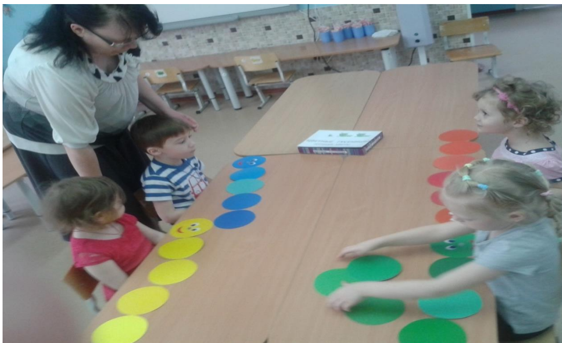
Рис. 4 Дидактическая игра «Цветные гусеницы», для определения оттенка основных цветов

Индивидуальные выставки детей в центре «Веселые капельки»