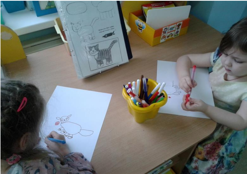
Рис. 8 Использование динамических таблиц.

Индивидуальные упражнения в рисовании детьми: