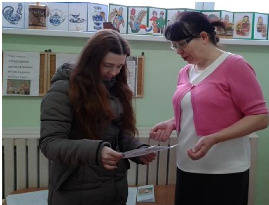
Рис. 6, 7 Памятки для родителей для раскрытия творческого потенциала детей дошкольного возраста