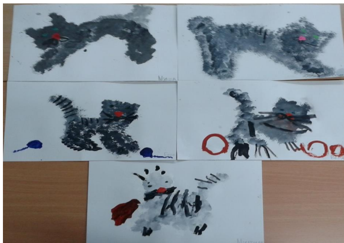
Рис. 1 «Рисование жесткой кистью, методом «тычкования», «Серенькая кошечка»

Оснащение центра художественно-эстетического развития «Веселые капельки» для организации изобразительной деятельности в разных техниках (совместно с воспитателем)