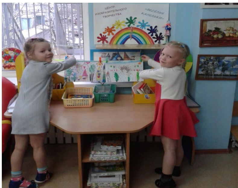
Рис. 5 Индивидуальная выставка

Индивидуальные выставки детей в центре «Веселые капельки»