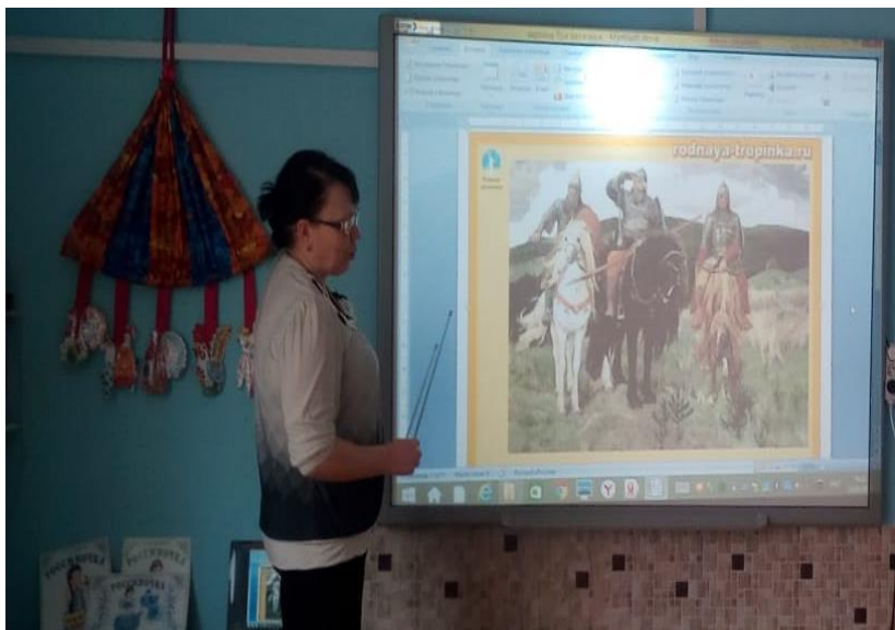
Рис. 2 Использование средств ИКТ

Дидактические игры для формирования сенсорных эталонов (самостоятельно, во взаимодействии со сверстниками):